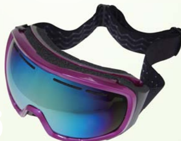
女裝 AH003 HK$185