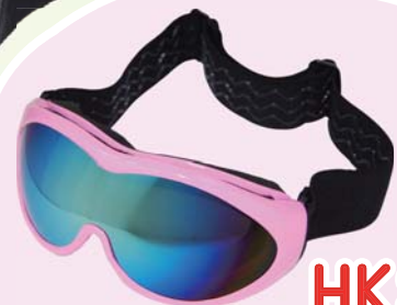
(Youth 童裝) AH004 HK$145