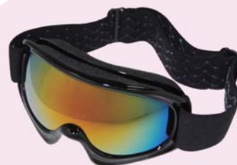
(Youth 童裝) AH005 HK$145