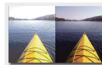
普通鏡片 偏光鏡片

Polaré 偏光鏡片能有效阻隔地面及水面所反射之眩光，除了可以緩減眼睛疲勞外，亦可增加集聚力，讓雙眼可以在更舒適之狀態下進行各種活動。由於 Polaré 偏光鏡擁有高於同類產品