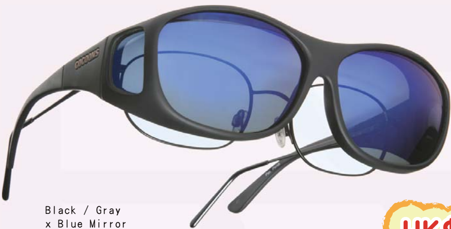
Black / Gray x Blue Mirror Size : M