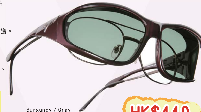
Burgundy / Gray Size : L