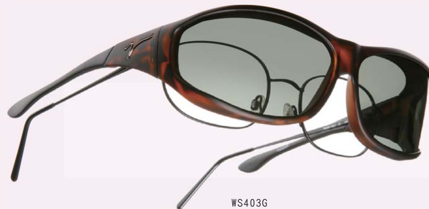
WS403G Tortoise / Gray